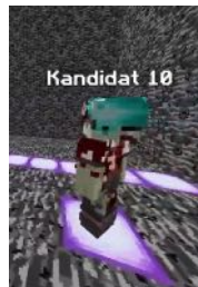
Gewinnerskin des Pixelwettbewerbes

Ihr seid neu auf GriegerGames? Dann schaut mal bei unserem Partner von ph Hilfe auf CB21 vorbei. Die Flensburger AngelaFlensburg und KlausFlensburg stellen euch auf ihrer Homepage www.griegergames.info Bieten die beiden euch neben ganz allgemeinen Anfängerhilfen auch ein breites Spektrum an Fragen und Antworten. Auch die Gelben Seiten soll es geben. Ihr sucht ein Casino, einen Shop, ein Kartenmuseum, InGame Anfängerhilfen? Hier findet ihr sie auf jedenfall.